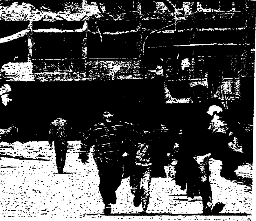
هاربون من رصاص القنص على المعبر